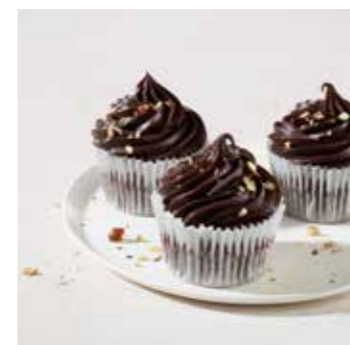
Čokoládová poleva ganache