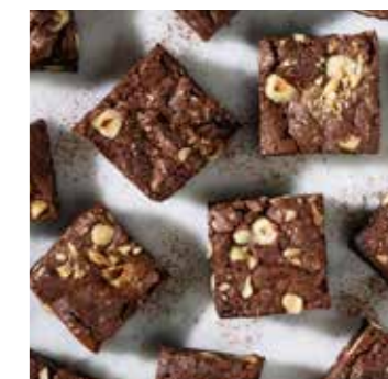
Brownies s lískovými oříšky