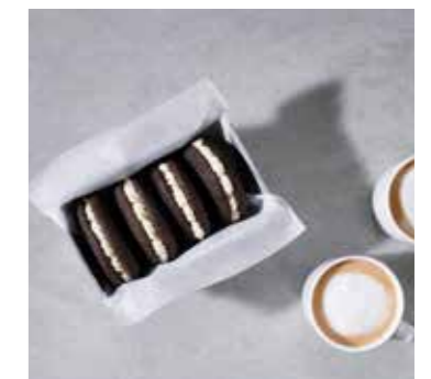
Černé kakaové slepované sušenky